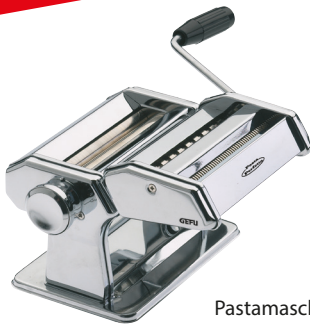
Pastamaschine PASTA PERFETTA DE LUXE Pasta Machine PASTA PERFETTA DE LUXE Art.-Nr.: 28300

· Mit Rezept · With recipe · Avec recette · Con ricetta · Con receta incluida · Met recept · С рецептом